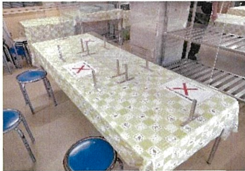
食堂のテーブル（パーティション設置）