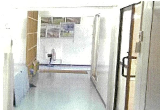
脱衣所（奥にサーキュレーター）